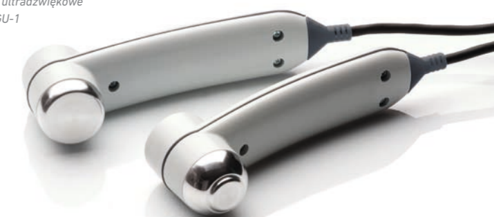
głowice ultradźwiękowe GU-5 i GU-1

Pozwala na samodzielne definiowanie parametrów zabiegowych.