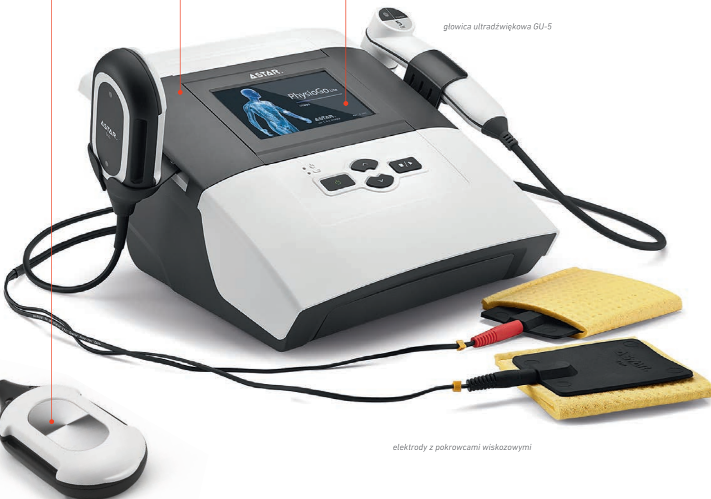
głowica ultradźwiękowa GU-5